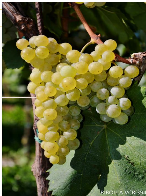
RIBOLLA VCR 394