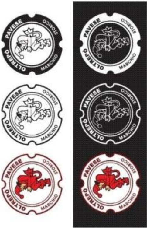
A colori su nero