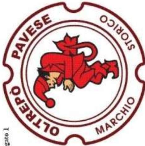
Presentazione marchio e sue applicazioni