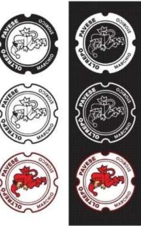
A colori su nero