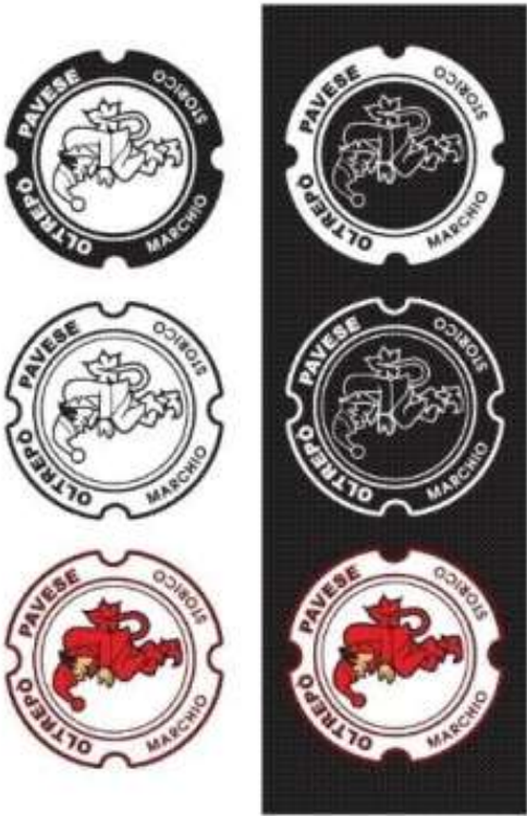
A colori su nero