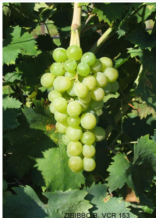
ZIBIBBO B. VCR 153